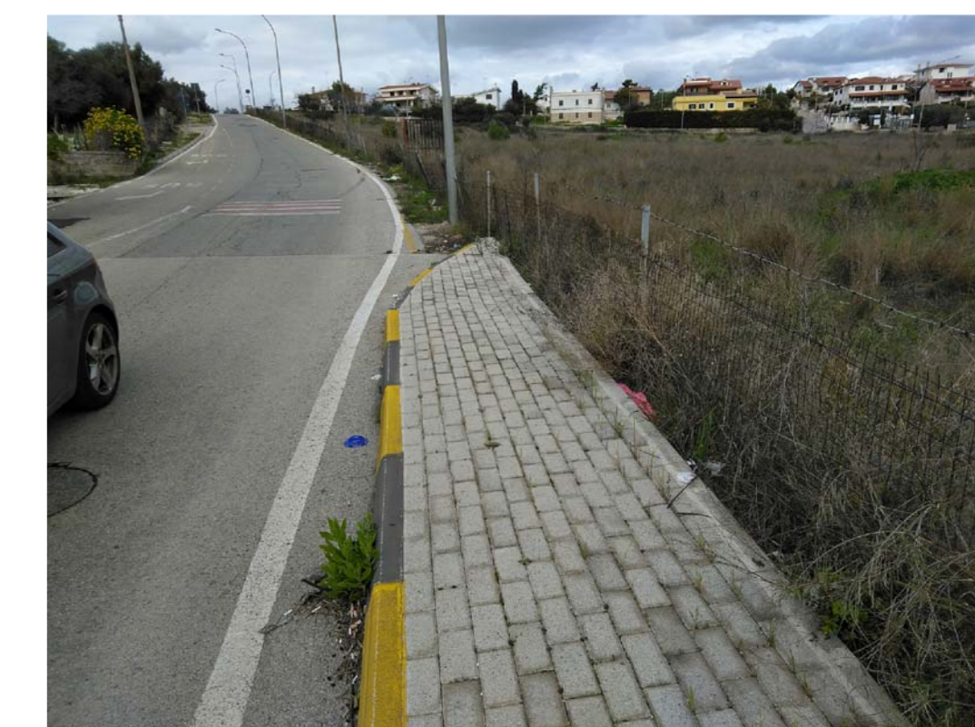
AUTOBLOCCANTI IN CLS TIPO 1 (come esistente)